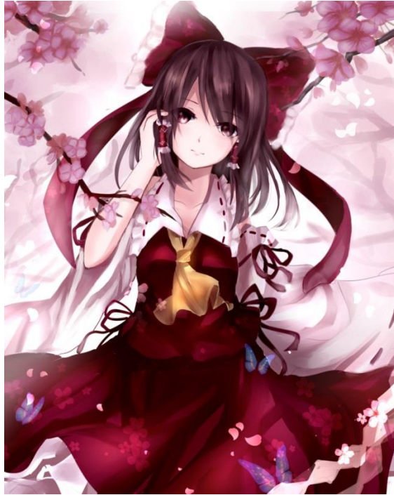
Marisa: Masculina y mentirosa.

Marisa es una chica de personalidad fuerte, egocéntrica, muy segura de sí misma y mala perdedora, tratar con este tipo de chicas no representa un verdadero desafío para quien entienda el arquetipo. Si lo que quieres es ganarte su confianza tan solo tendrás que actuar por debajo de ella, si tu humano, demuestras una total confianza y seguridad lo más probable es que termine utilizando el mini Hakkero en ti, llamar su atención es algo que cualquiera podría manejar, se sabe que cuando encuentra algo interesante actuara rápidamente, cosas que para nosotros son de uso diario para ella un tesoro, el móvil, aquel llavero con luces que guardas en el cajón o simplemente una bolsa de patatas saladas, todo eso podría servir.